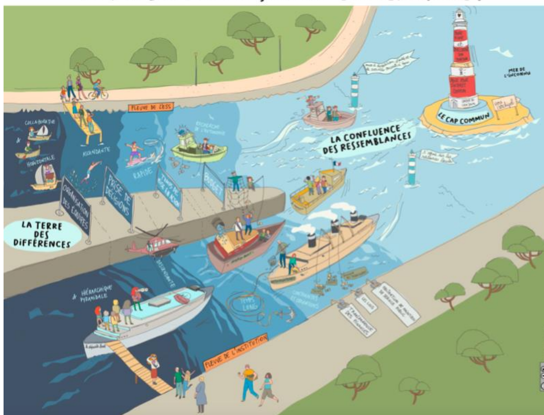
Illustration réalisée par Mélanie Cidière et Aurélie Alléon